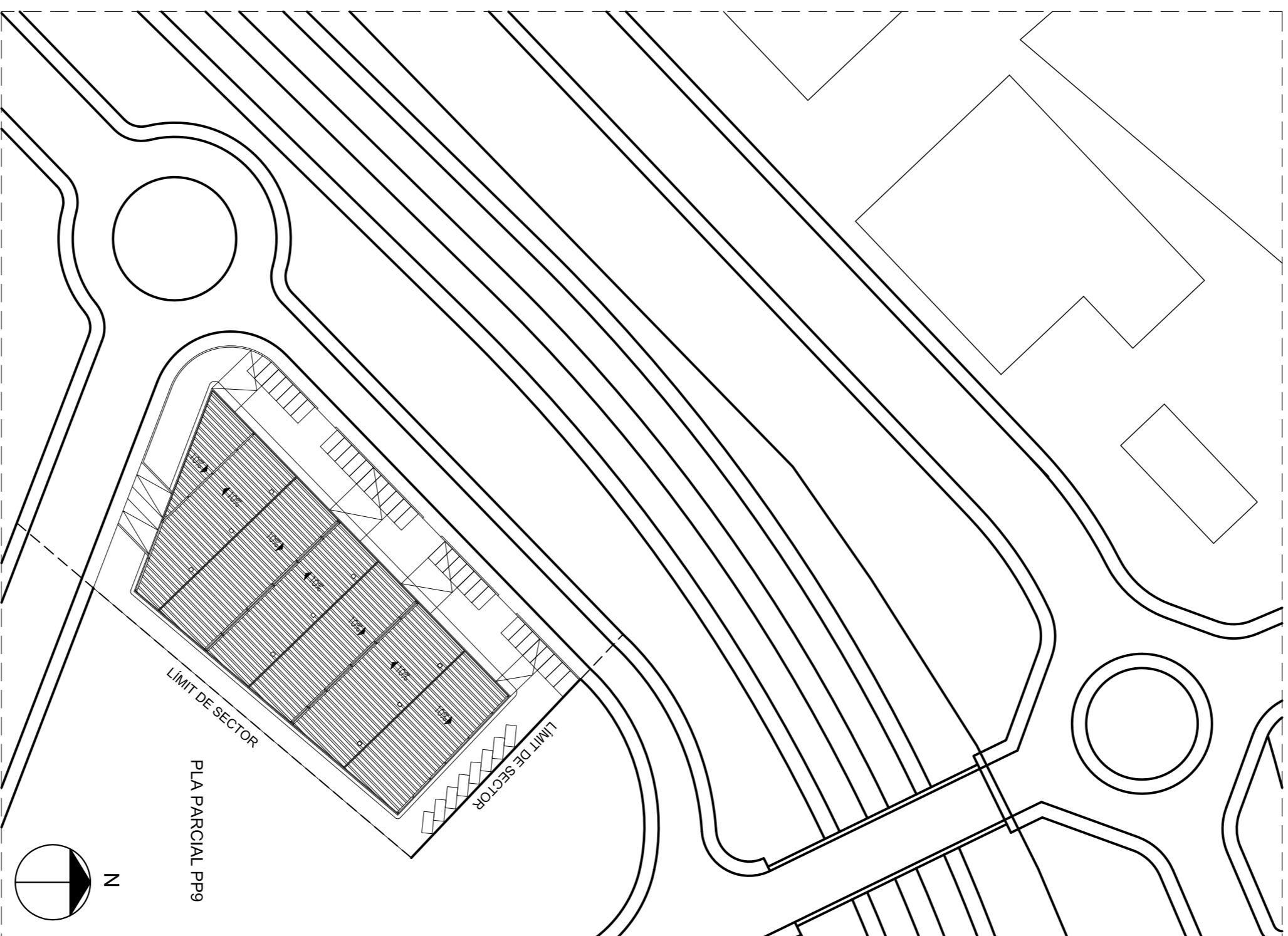
PARCEL·LA E: 1/11.000

CEDULA DE QUALIFICACIÓ URBANÍSTICA PLA ESPECIAL DE REFORMA INTERIOR SUBPOLIGON PP-9 (CENTROS COMERCIALES PRIVCA) SOL URBÀ. ZONA I: EDIFICACIÓ PRIVADA COMERCIAL E INDUSTRIAL